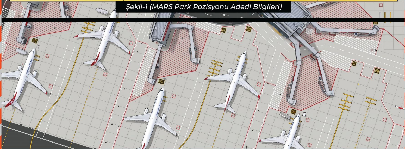
Şekil-1 (MARS Park Pozisyonu Adedi Bilgileri)